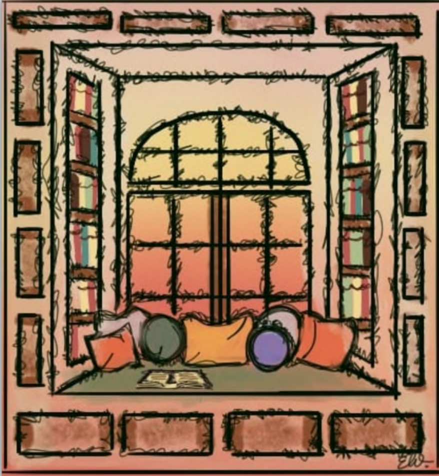
Çizim: Elif Oruç

Avlunun ortasında durup başımı kaldırdım. Pencere önünde oturan nine ile göz göze geldim. “Buralı değilsin” dedi bakışları ve kumandaya uzanıp kanal değiştirdi. İçimdeki bütün sehpa devrildi, bütün tespihlerin ipleri koptu ve taneleri yerlere saçıldı. Nemli gözlerimi silip solan yapraklara değil kendime ağladım. Ne güz ne de yapraklar umurumdaydı. O çocuk mutluymuş, yaşlı kadın mutluymuş. Arkamı dönüp sokak kapısına doğru yürüdüm. Buna yürümek mi denir sürünmek mi bilemedim. Önde pejmürde bir kıyafet yalpalayarak gidiyordu ardında bir ruh ona yetişmeye çalışıyordu. Bir kertenkele taş duvarın aralığına kaçtı. Bir karınca yuvasının üstünden atlardım. Dönüp üstüne bassam mı diye düşündüm. Utanıp yerin dibine girdim, yılanlar bile yuvalarında geriniyordu. Mutlu, kaygısız ve umursamazdılar. Tahta kapıdan geçip yazgımın peşinde yeni mağlubiyetlere yol aldım.