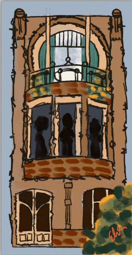
Çizim: Elif Oruç